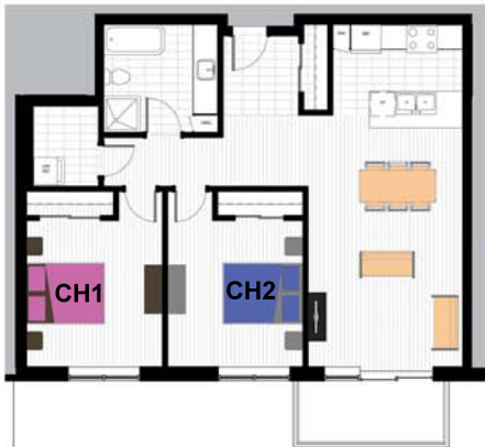
2e à 6e étage