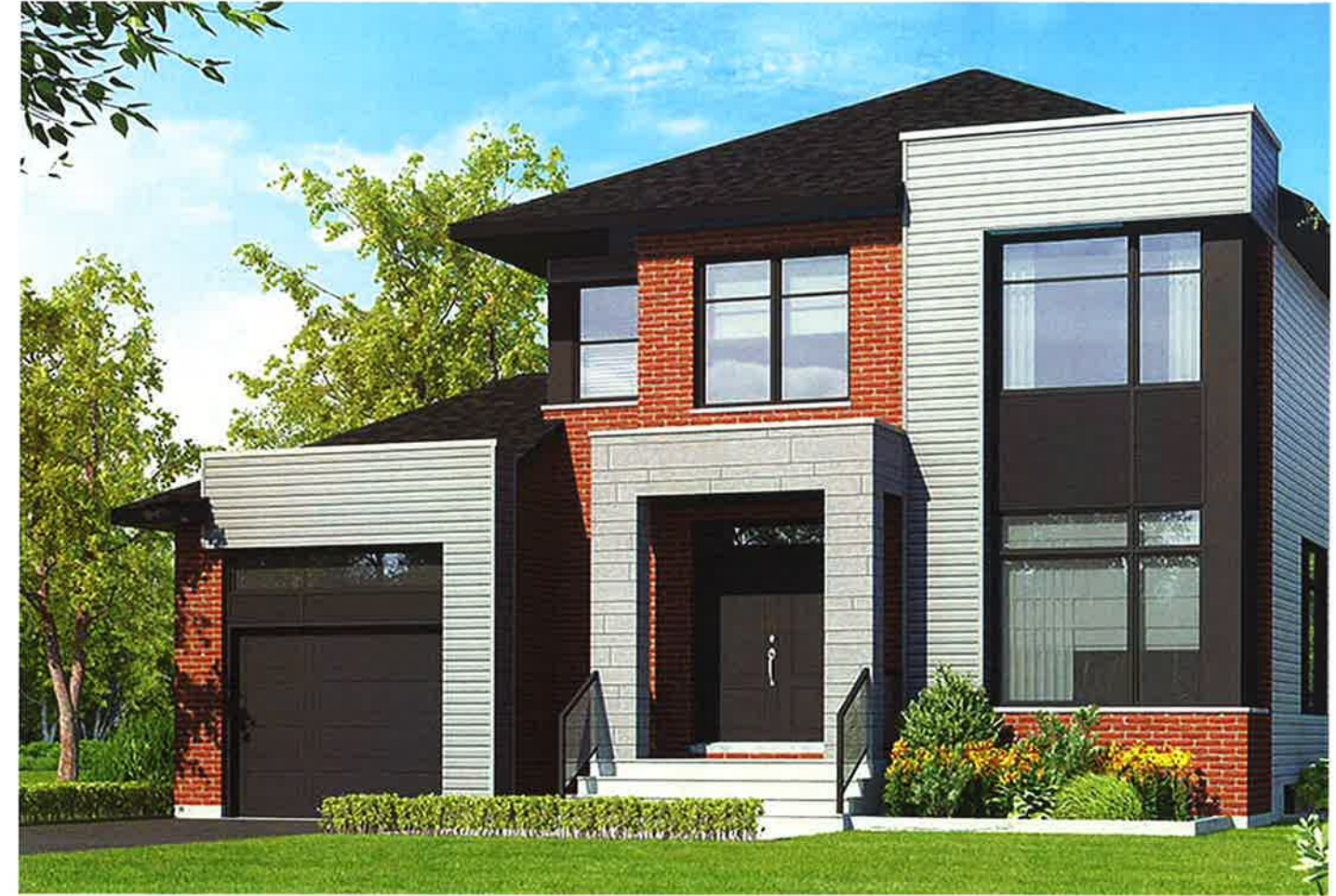
L'illustration ci-dessus peut inclure des items optionnels. Vous référer au plan intérieur pour les spécifications de base du modèle.