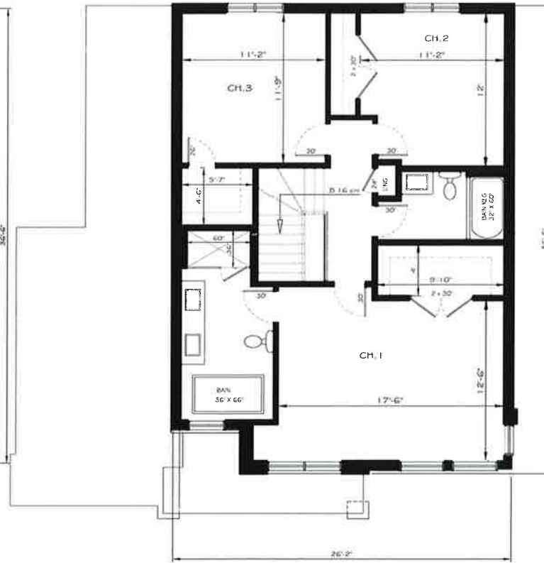
Option 2 SDB à l'étage: