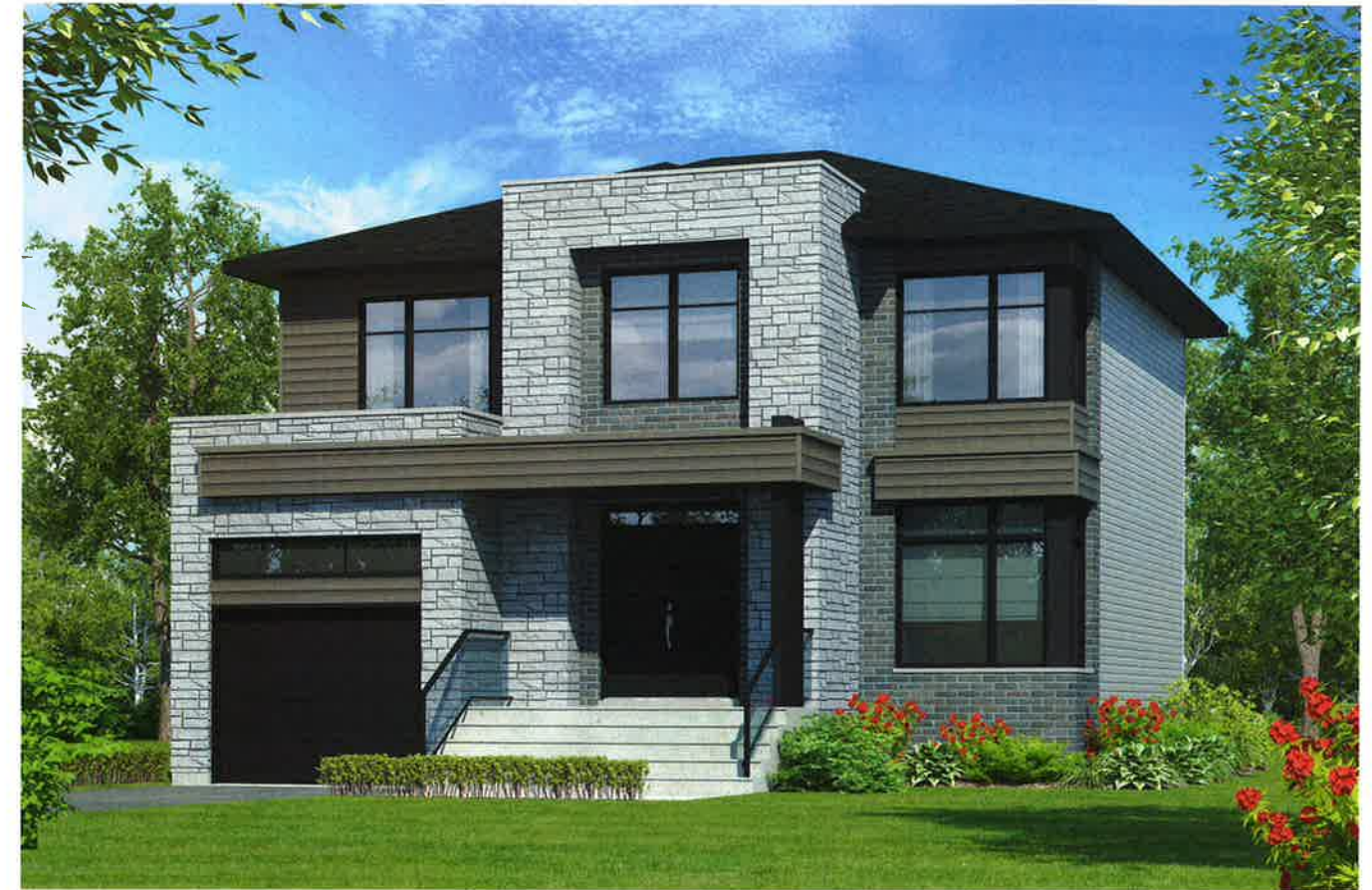
L'illustration ci-dessus peut inclure des items optionnels. Vous référer au plan intérieur pour les spécifications de base du modèle.