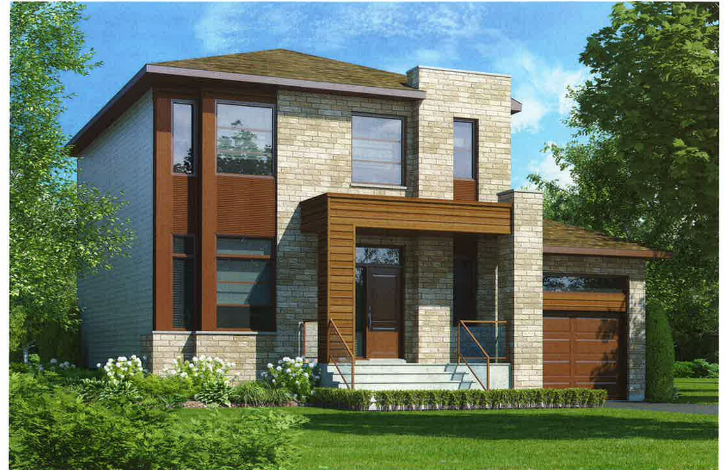
L'illustration ci-dessus peut inclure des items optionnels. Vous référer au plan intérieur pour les spécifications de base du modèle.

Option salle familiale au-dessus du garage (disponible avec standard 1SDB ou opt 2 SDB)